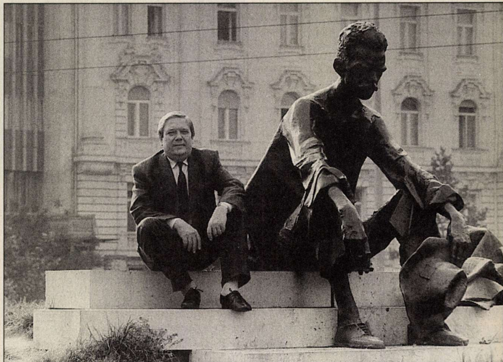
Összeomlott az utolsó nagy pártállami karrier

Mi a magyar? – tehették fel az örök köldök-néző vitakérdést a nemzeti arculat konzervatív formatervezői csöndesebb hétköznapiakon Kossuth téri kormányzószobájukban. Mi felel meg a nemzet természetének? Mi következik ezeréves történelmünk háromismeretlenes egyenletéből? És megoldották. Tízből tízszer