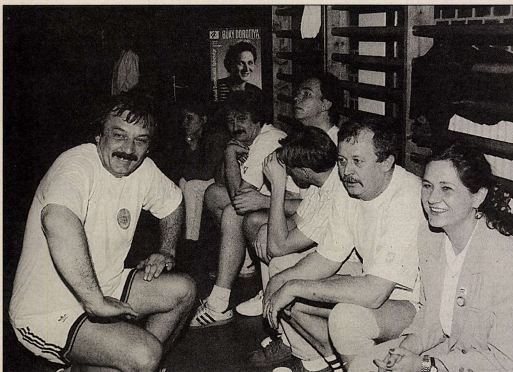
'94-ben, újra másodikként...

Az SZDSZ ma szerepvárvan feszengő, lelki-furdalásos, bizonytalan pártnak látszik. Egyetlen világos programuzenete a költségvetési egyensúly mindenáron való megteremtése – amint a személyi szám eltörlésével kapcsolatos alkotmánybírói játszma mutatja –, még a legfontosabb liberális programelvek feladása árán is. A Bokros-csomag következetes támogatásáról talán még el lehet hitetni, hogy az nem más, mint az államháztartás régóta ígért reformjának kezdete. (Nem az.) Ez még úgyahogy beilleszthető egy liberális, annál kevésbé egy etatista múltú szocialista párt világké-